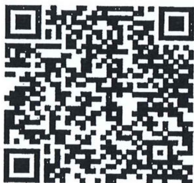
QR Code วิธีการลงทะเบียน และการรับสมัคร