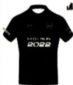
เสื้อวิ่ง